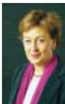
Marylise LEBRANCHU 53 ans - Ministre de la Justice, Garde des Sceaux Présidente de la CAPM