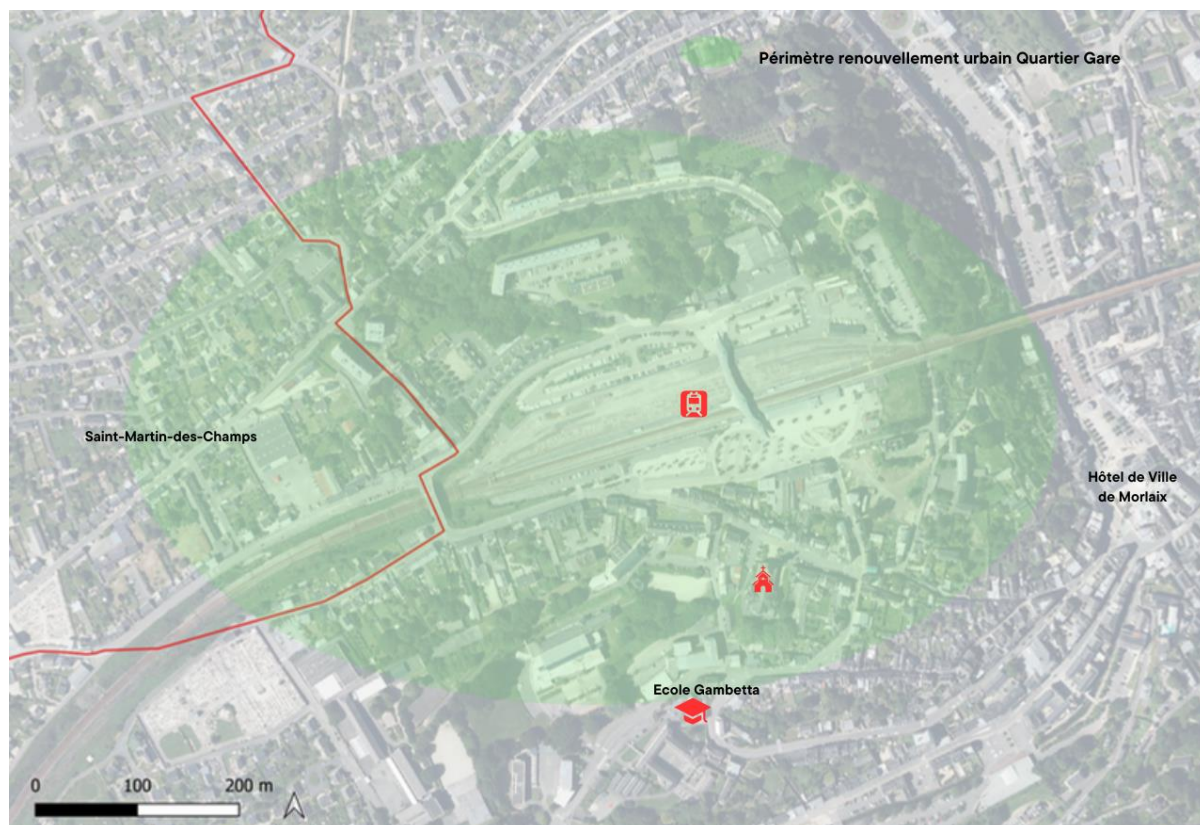
Figure 3 – Localisation du périmètre du renouvellement urbain du quartier gare, échelle centre-ville de Morlaix/ Saint-Martin-des-Champs