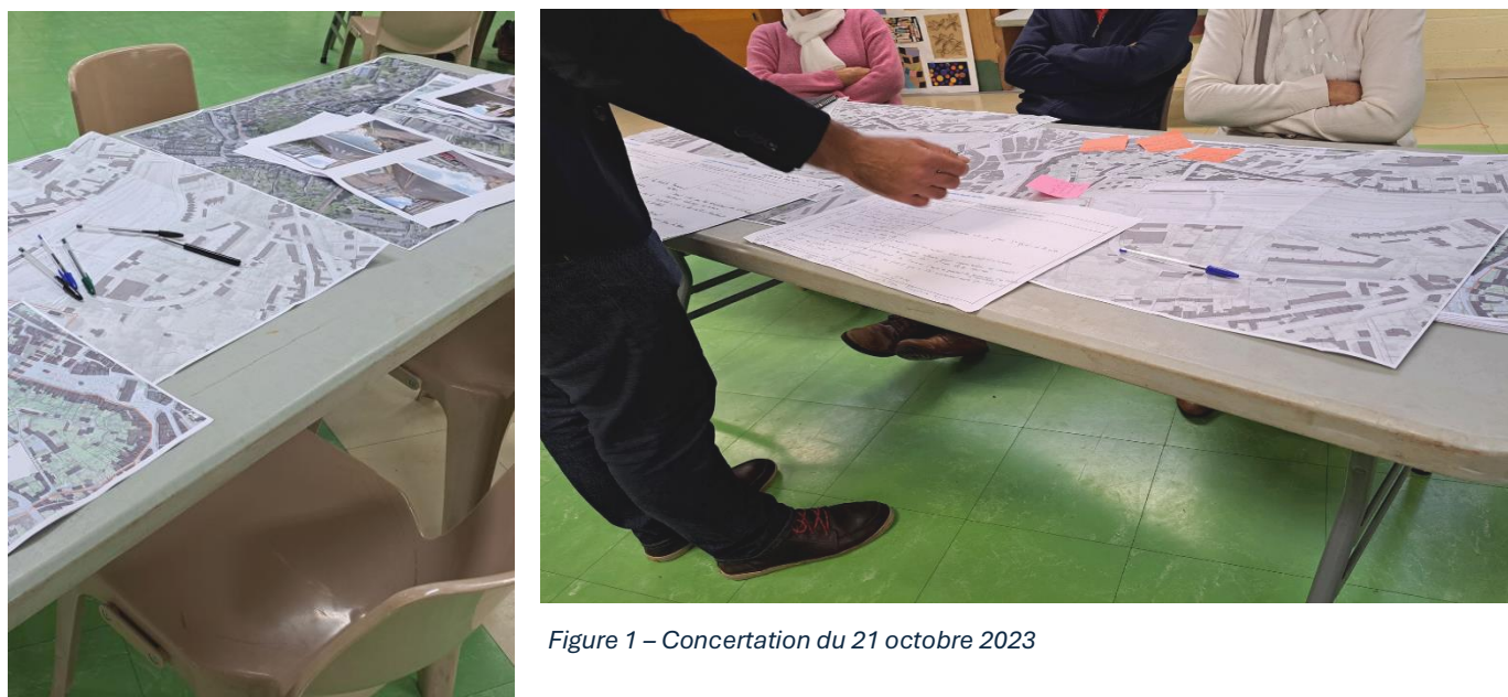
Figure 1 – Concertation du 21 octobre 2023

Un nouveau temps de concertation est prévu, le 12 juin 2024, dans le cadre de la phase « plan guide/ scénario d'aménagement » du quartier gare.